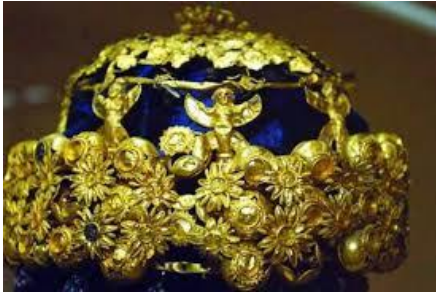
تاج من الذهب في العراق

اشتهر سكان بلاد العراق القديم بالكثير من