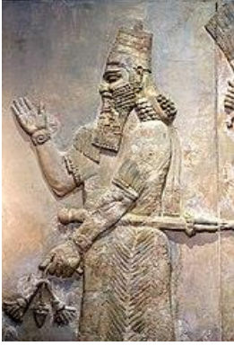
الملك سرجون الثاني