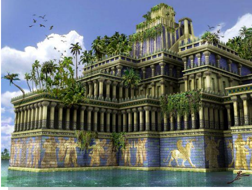
حدائق بابل المعلقة

برع الآشوريون في فن العمارة حيث اهتم الملك الآشوري سنحاريب بتعمير مدينة نينوى إحدى عواصم الآشوريين ) ، وصمم على جعلها أجمل وأروع من بابل التي قام بتخريبها .