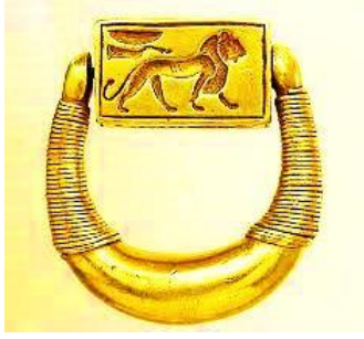
ختم حور محب