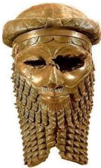
الملك سرجون الاول