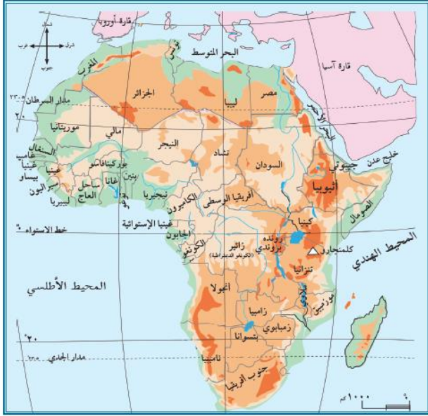
خريطة قارة إفريقيا

نشاط ١ عزيزي الطالب: تأمل خريطة قارة إفريقيا، ثم أجب عما يأتي: